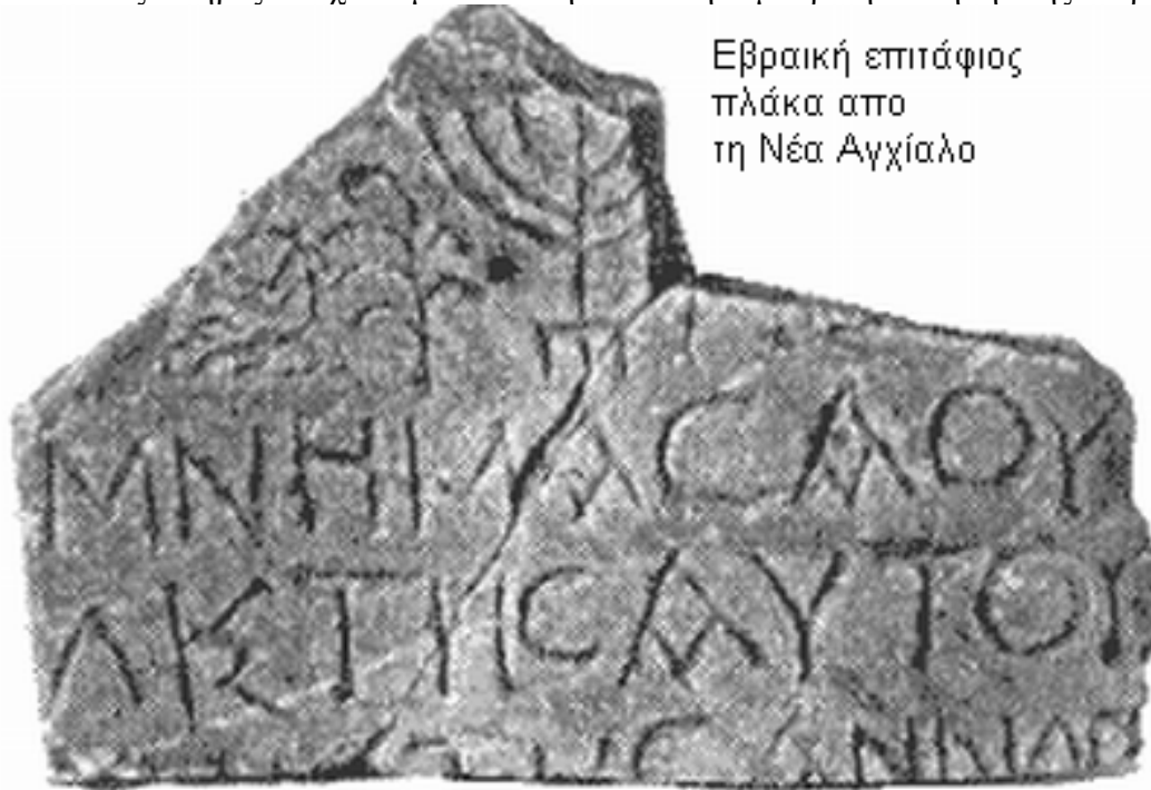
Εβραϊκή επιτάφιος πλάκα απο τη Νέα Αγχίαλο

Φθιώτιδες Θήβες δείχνει μάλλον την έντονη εμπορική κίνηση της περιοχής.