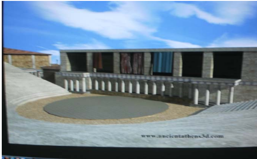
Εικονική αναπαράσταση 17 της σκηνής του θεάτρου

Σήμερα είναι αποδεκτή η άποψη Dorfheld ότι όλη η δράση περιοριζόταν στην Ορχήστρα, ενώ στην οροφή της σκηνής παρουσιάζονταν οι υποκριτές ορισμένες φορές ως «από μηχανής θεοί» με την βοήθεια περιστρεφόμενου γερανού. Το Προσκήνιο ήταν μια ελαφρά κιονοστοιχία από δωρικούς κίονες με πλήρη θριγκό και βαθιά οροφή που προστέθηκε μπροστά από τον τοίχο της σκηνής. Στις δύο άκρες της στοάς υπήρχαν συμμετρικά τα «παρασκήνια». Το πίσω κτήριο της κυρίως σκηνής υπερυψούται, ώστε να δημιουργηθεί πρόσοψη, όπου τοποθετούσαν γραπτούς πίνακες. Τον 2ο αιώνα δημιουργήθηκε το «λογείο», ένα υπερυψωμένο πάτωμα επάνω στο οποίο έπαιζαν πλέον οι υποκριτές. Στην κάτωψη που παρατίθεται πιο κάτω βλέπουμε τα δύο διαζώματα του διονυσιακού θεάτρου. Πάνω από το δεύτερο διάζωμα έγινε επέκταση του κοίλου με εδώλια λαξευμένα στο φυσικό βράχο και ονομάσθηκε επιθέατρον. Στην άνω απόληξη του κοίλου σχηματιζόταν περιμετρικός διάδρομος με στοά σε ένα μέρος του, ο οποίος περιέτρεχε την Ακρόπολη και ονομαζόταν «περίπατος».