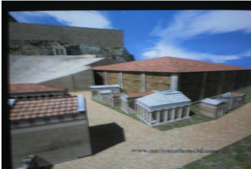
Ωδείο του Περικλή

Από εκεί ξεκινούσε και η οδός Τριπόδων με τα χορηγικά μνημεία, όπως φαίνεται και στην εικονική αναπαράσταση 13